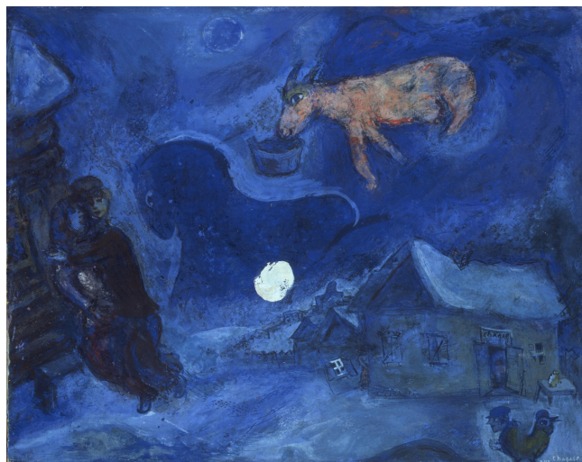
Marc Chagall, Dans mon pays

Tancredi Parmeggiani , A proposito di Venezia (1958)